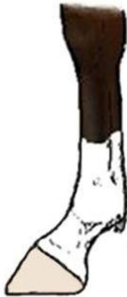
Κνημιδοφόρος (sock half or full)