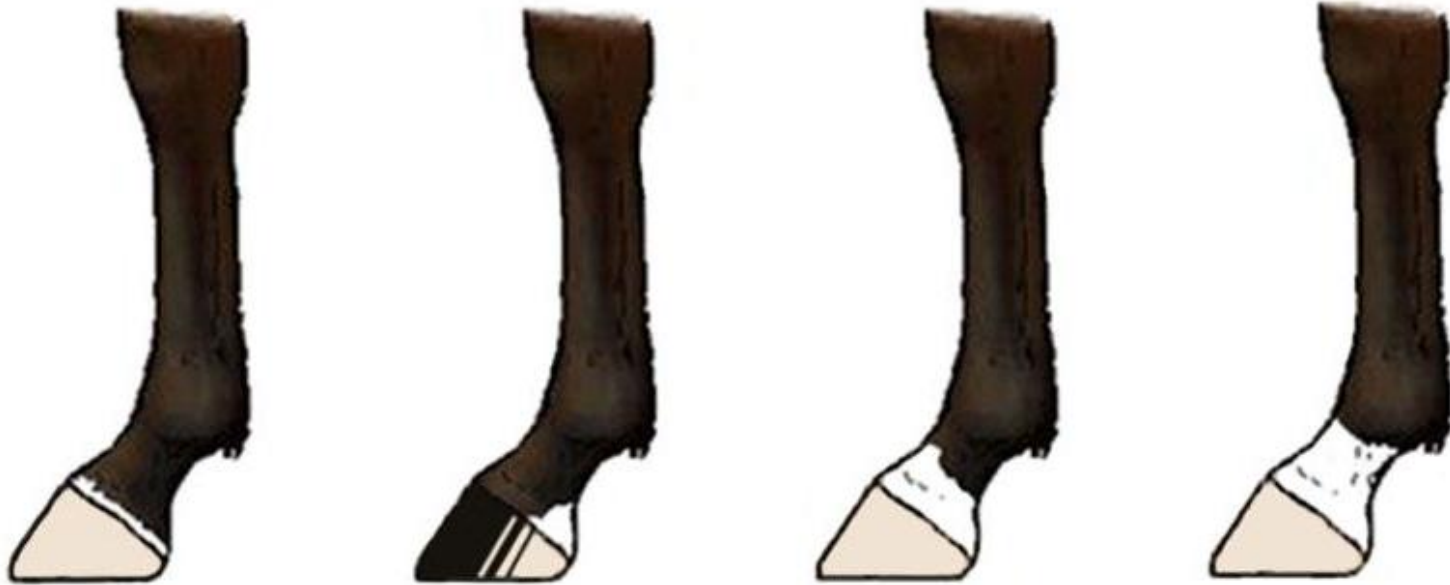
Ολοστεφής (coronet) Λευκή κηλίδα (white heel) Ημι-χοϊνικοφόρος (half-pastern) Χοϊνικοφόρος (pastern)