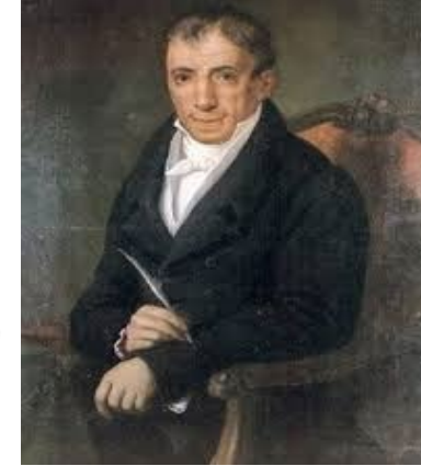
Αδ. Κοραής (1798)

Όλα ταύτα και άλλα μύρια κακά προέρχονται από την παράνομον των Τούρκων διοίκησιν.