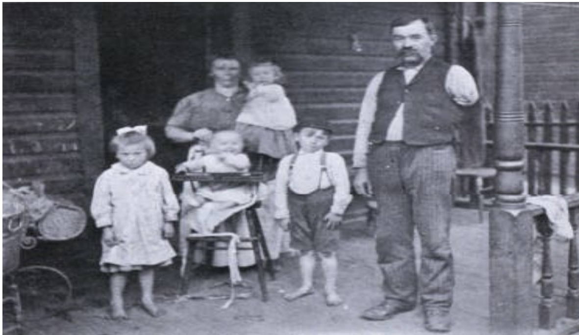
One arm and four children, 1910