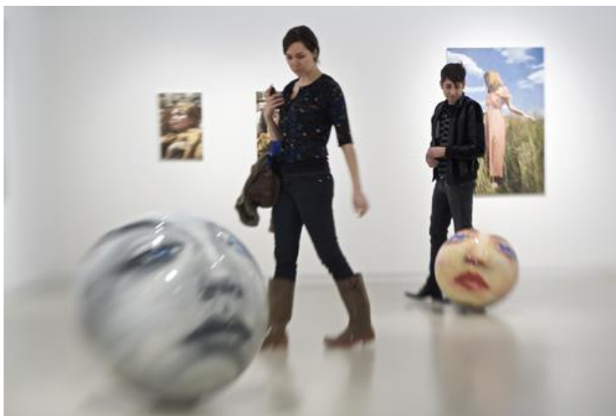
Mike Weiss Gallery στην Art Chicago.

Όσον αφορά την οικονομική μεταμοντέρνα πραγματικότητα, αυτή περιγράφεται ως ευέλικτη συσσώρευση κεφαλαίου - νέες τεχνολογίες και “κινητικότητα” εργαζομένων, με χωρική αποσύνδεση της διοίκησης και της παραγωγής των επιχειρήσεων, που μπορεί να τις απομακρύνει μέχρι και σε διαφορετικές χώρες ή ακόμα και σε διαφορετικές ηπείρους.