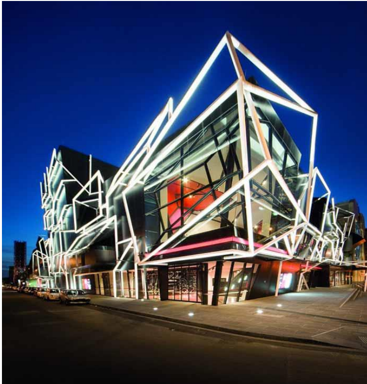
Theatrical Masterpiece, του Ashton Raggatt McDougal, στη Μελβούρνη.

Είναι γεγονός πως ο “μοντερνισμός” και ότι αυτός αντιπροσώπευε έχει ανεπιστρεπτί παρέλθει.