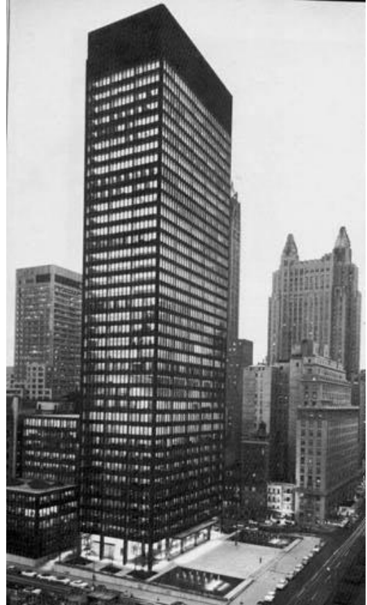
Seagram Building των Ludwig Mies van der Rohe και Philip Johnson, Νέα Υόρκη 1957.