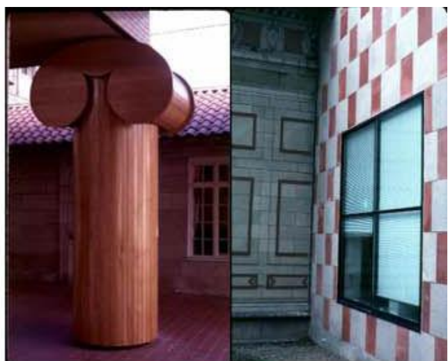
Fire station No 4, του Robert Venturi.