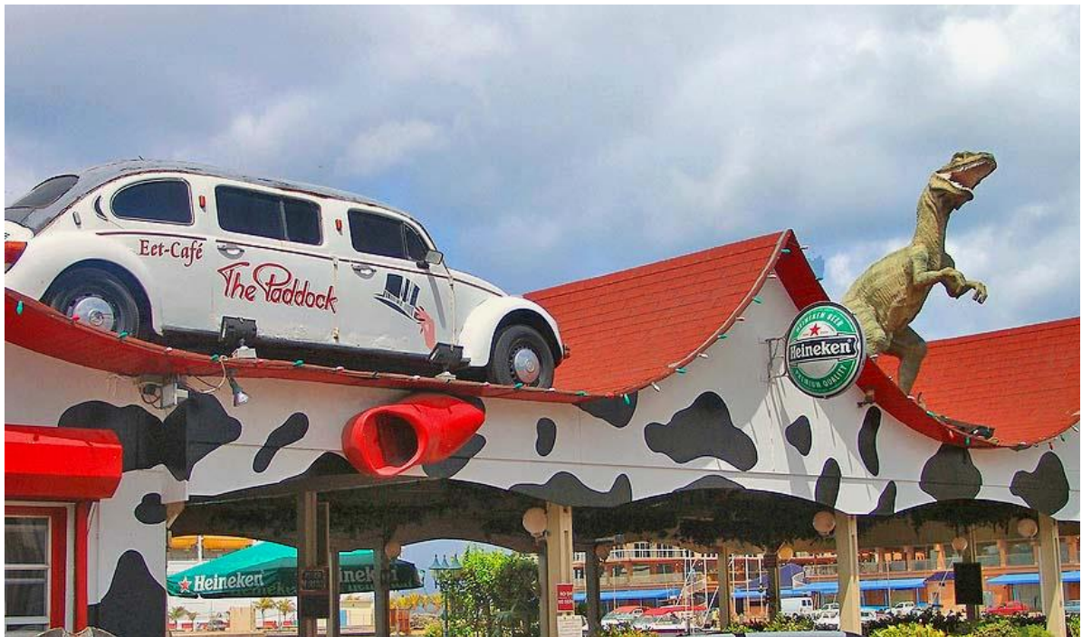
Εστιατόριο Wacky στην Αρούμπα.

Γινόμαστε, πια, στις σύγχρονες πόλεις μας, μάρτυρες μιας “αρχιτεκτονικής του εφήμερου”, που δεν ενδιαφέρεται να διαρκέσει, απλά έρχεται να υπηρετήσει κάποια ανάγκη πρόσκαιρη, συνήθως σκοπούς εμπορικούς, “παριστάνοντας” πράγματα που δεν “είναι”, χρησιμοποιώντας τεχνάσματα για να παραπλανά και να μεγεθύνει, ενσωματώνοντας, συχνά, μορφές αδόκιμες, μ’ ένα τρόπο αδέξιο, παιχνιδιάρικο, κάποτε ειρωνικό. Το φαινόμενο δεν είναι άσχετο με το νέο διαμορφούμενο αρχιτεκτονικό αλλά και κοινωνικοοικονομικό περιβάλλον.