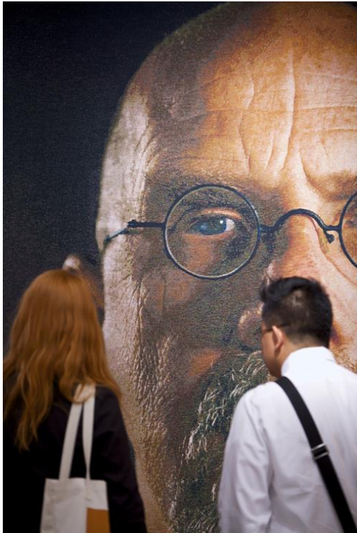
Έργο του Chuck Close στην Art Chicago.

Το ανάλογο ισχύει στην τέχνη, όπου την μονιμότητα της ζωγραφικής του τελάρου ή της γλυπτικής του μαρμάρου διαδέχθηκε η φευγαλέα πραγματικότητα της εικόνας του βίντεο ή του λείζερ.