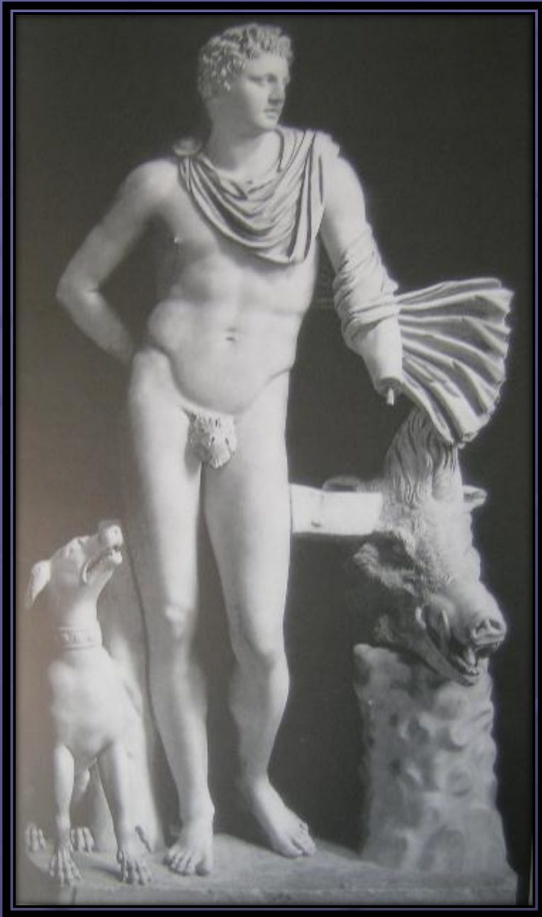
Αγαματικός τύπος Μελεάγρου. Αντίγραφο, Μουσεία Βατικανού 490.