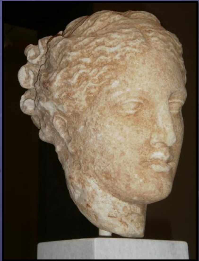
Η κεφαλή Μούσας ή Νύμφης από τον βωμό στο ιερό της Αθηνάς Αλέας πιθανότατα. Πρωτότυπο έργο του Πάριου Σκόπα. Αθήνα, Εθνικό Αρχαιολογικό Μουσείο 3602.