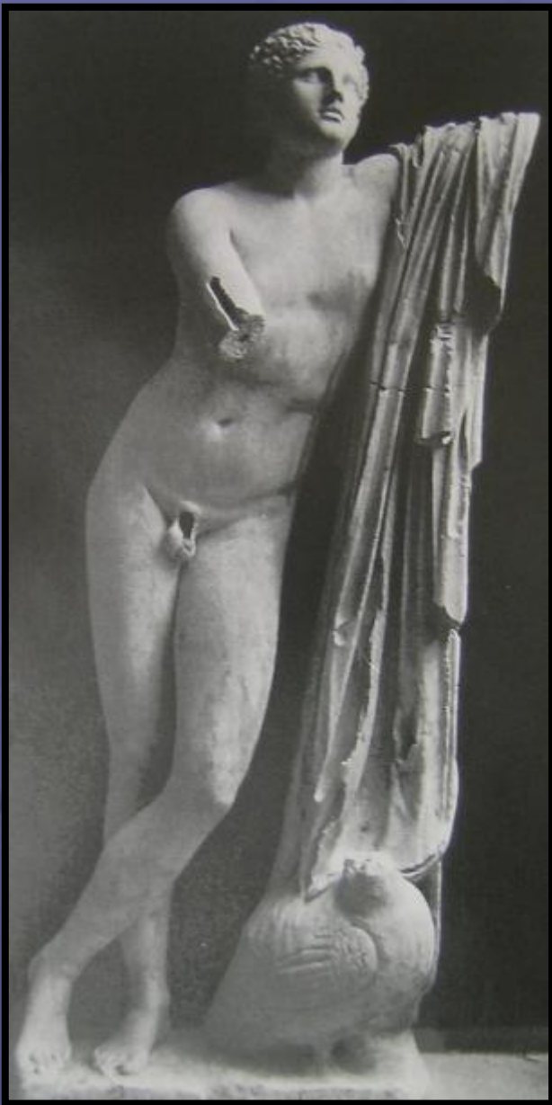
Ο αγαλματικός τύπος του Πόθου. Ρώμη.