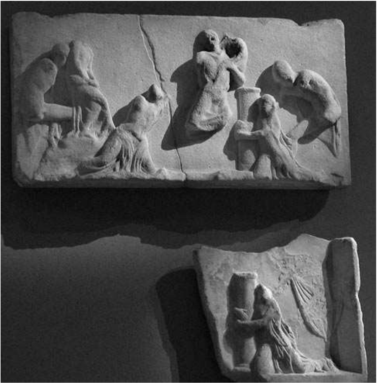
Εικ. 4. Πλάκα Ε από τη ζωφόρο του ναού του Ιλισού και ανάγλυφος ρωμαϊκός πίνακας από την Έφεσο. Βιέννη, Kunsthistorisches Museum, αρ. ευρ. I 1093 και I 868, αντίστοιχα (φωτ.: H. R. Goette).

Ο ιωνικός ναός στον Ιλισό και η ζωφόρος του εννέα χρόνια μετά