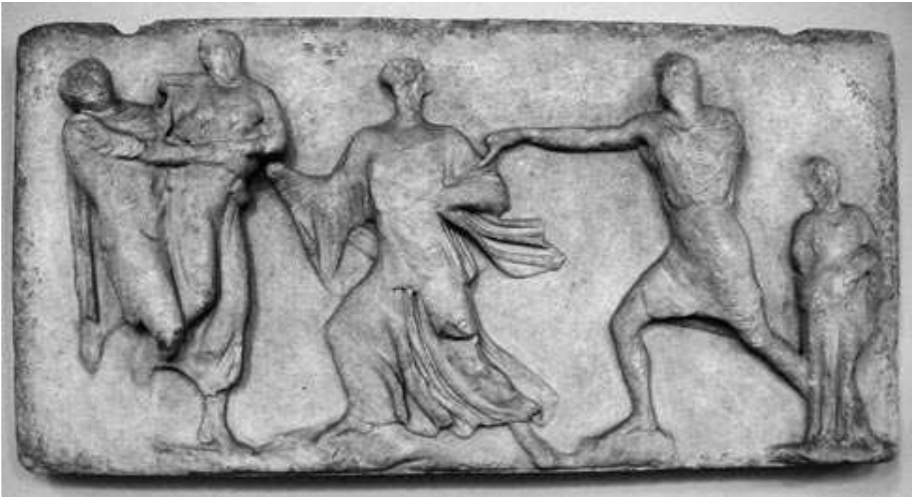
Εικ. 2. Πλάκα D από τη ζωφόρο του ναού του Ιλισού.

Ο ιωνικός ναός στον Ιλισό και η ζωφόρος του εννέα χρόνια μετά