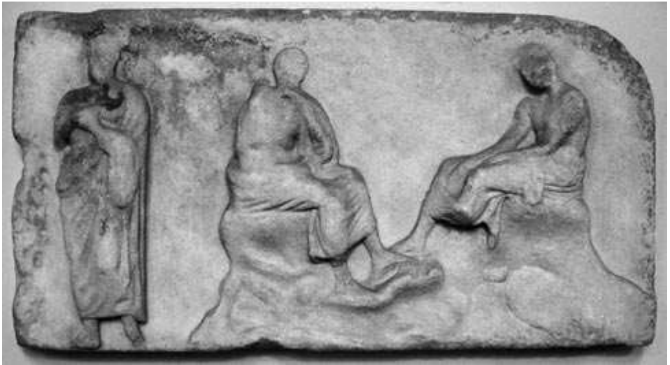
Εικ. 1. Πλάκα Β από τη ζωφόρο του ναού του Ιλισού. Βερολίνο, Antikensammlung, Staatliche Museen - Preussischer Kulturbesitz, αρ. ευρ. Sk 1483.

χθείου. 8 Μπορεί κανείς να σχετίσει αυτές τις συνθέσεις τελικά με ένα άλλο πνεύμα, διαφορετικό από τη θριαμβική έξαρση των πολεμικών ζωφόρων της Αθηνάς Νίκης και με μία άλλη περισσότερο ήρεμη τεχνοτροπία, αντίθετη στον Πλούσιο ρυθμό, που διαγνώσθηκε στην αττική πλαστική στη δεκαετία 430-420 π.Χ. 9 Σχετικά αραιά διευθετημένες είναι και οι μορφές των πολεμιστών στην ανατολική ζωφόρο του Ηφαιστείου (430-425 π.Χ.). 10 Ίσως επίσης η χρήση του παριανού μαρμάρου να συνδέεται με συγκεκριμένες καλλιτεχνικές επιλογές. 11 Αλλά και ο οικονομικός υπολογισμός ενδέχεται να είχε τη σημασία του. Αραιότερα διευθετημένες μορφές μπορεί να είναι λιγότερες, ενώ συνεπάγονται και ευκολία στη λάξευσή τους, οπότε το κόστος θα ήταν σε αυτήν την περίπτωση μειωμένο.