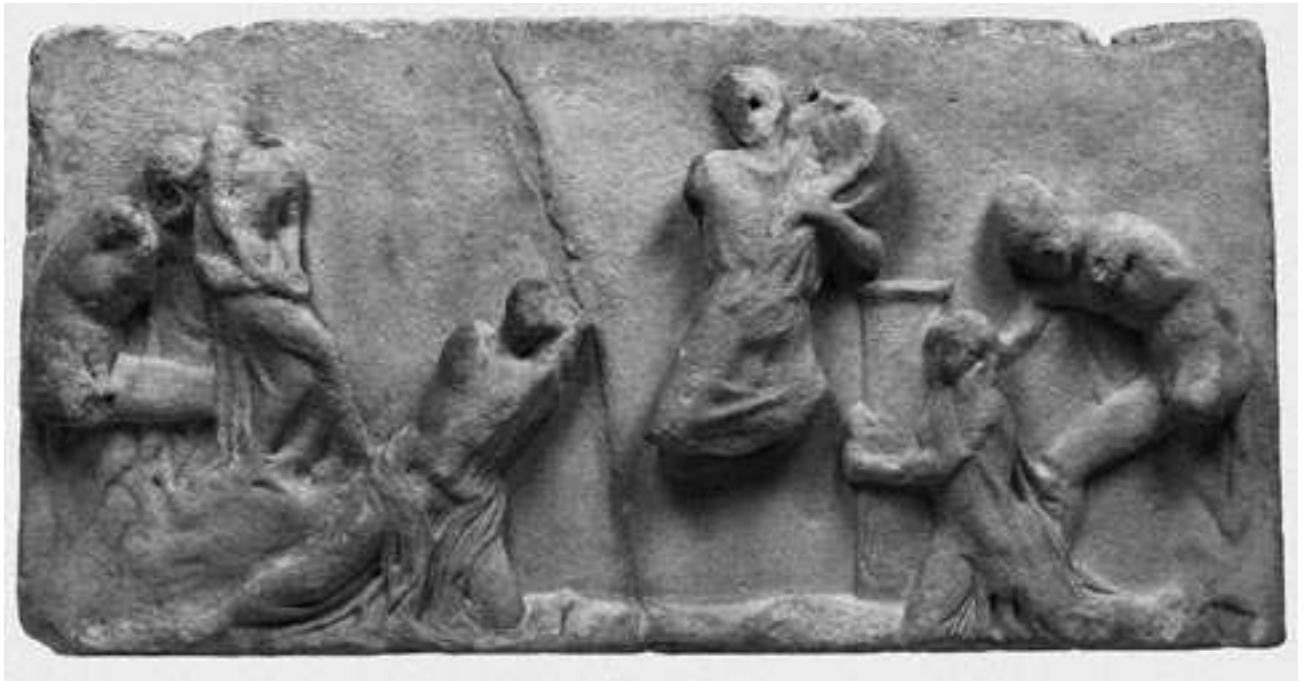
Εικ. 3. Πλάκα Ε από τη ζωφόρο του ναού του Ιλισού. Βιέννη, Kunsthistorisches Museum, αρ. ευρ. I 1093 (φωτ.: H. R. Goette).

δεχθούμε ότι οι δύο ναοί ήταν σύγχρονοι και είχαν ανεγερθεί μέσα στο κοινό ιδεολογικό πνεύμα των νικών του Αρχιδάμειου πολέμου, στα μέσα της δεκαετίας 430-420 π.Χ. Ο ναός της Αθηνάς Νίκης στην Ακρόπολη ήταν αφιερωμένος σε μια παλαιά θεά της γονιμότητας που συνδύαζε επίσης τον πολεμικό χαρακτήρα, με αναφορά σε πρόσφατες και περίφημες αθηναϊκές νίκες, όπως αυτή του Μαραθώνα, η οποία και απεικονιζόταν στη νότια ζωφόρο του. Αντίστοιχα, θα ήταν εύλογο ένας περίπου σύγχρονος και δίδυμος ιωνικός ναός, στην άμεση ύπαιθρο και σε μία από τις ιερότερες περιοχές των αρχαίων αθηναϊκών λατρειών, να είχε αφιερωθεί επίσης σε μια παρόμοια θεά της γονιμότητας, που έλαβε ιδιαίτερη έμφαση στη λατρεία για τη συμβολή της στη νίκη των Αθηναίων κατά των Περσών στον Μαραθώνα. 26 Η πιθανότητα και οι δύο αυτοί ναοί να οφείλονται σε κοινό αρχιτέκτονα, τον Καλλικράτη, συζητείται πλέον σοβαρά στη νεότερη έρευνα. 27