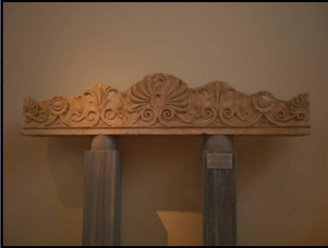
Επίστεψη από το μνημείο των πεσόντων στην Κόρινθο και την Κορώνεια της Βοιωτίας Αθηναίων ιππέων το 394 π.Χ. προερχόμενο από το Δημόσιο Σήμα. Αθήνα, Εθνικό Αρχαιολογικό Μουσείο 754.