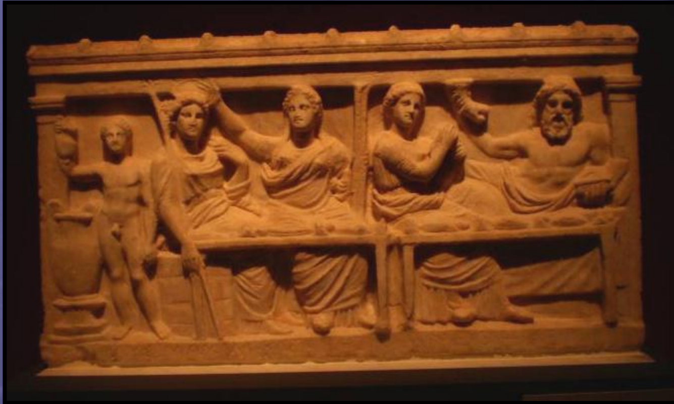
Αναθηματικό ανάγλυφο του Λυσιμαχίδη στις ελευσινιακές θεότητες στον τύπο των αναγλύφων συμποσιαζόντων. Απεικονίζονται τα δύο ζεύγη των λατρευόμενων στην Ελευσίνα θεών, Δήμητρα και Κόρη, αριστερά. Θεός και Θεά δεξιά (δηλαδή Περσεφόνη και Άδης) Περ. 330 π.Χ. Αθήνα, Εθνικό Αρχαιολογικό Μουσείο 3527.