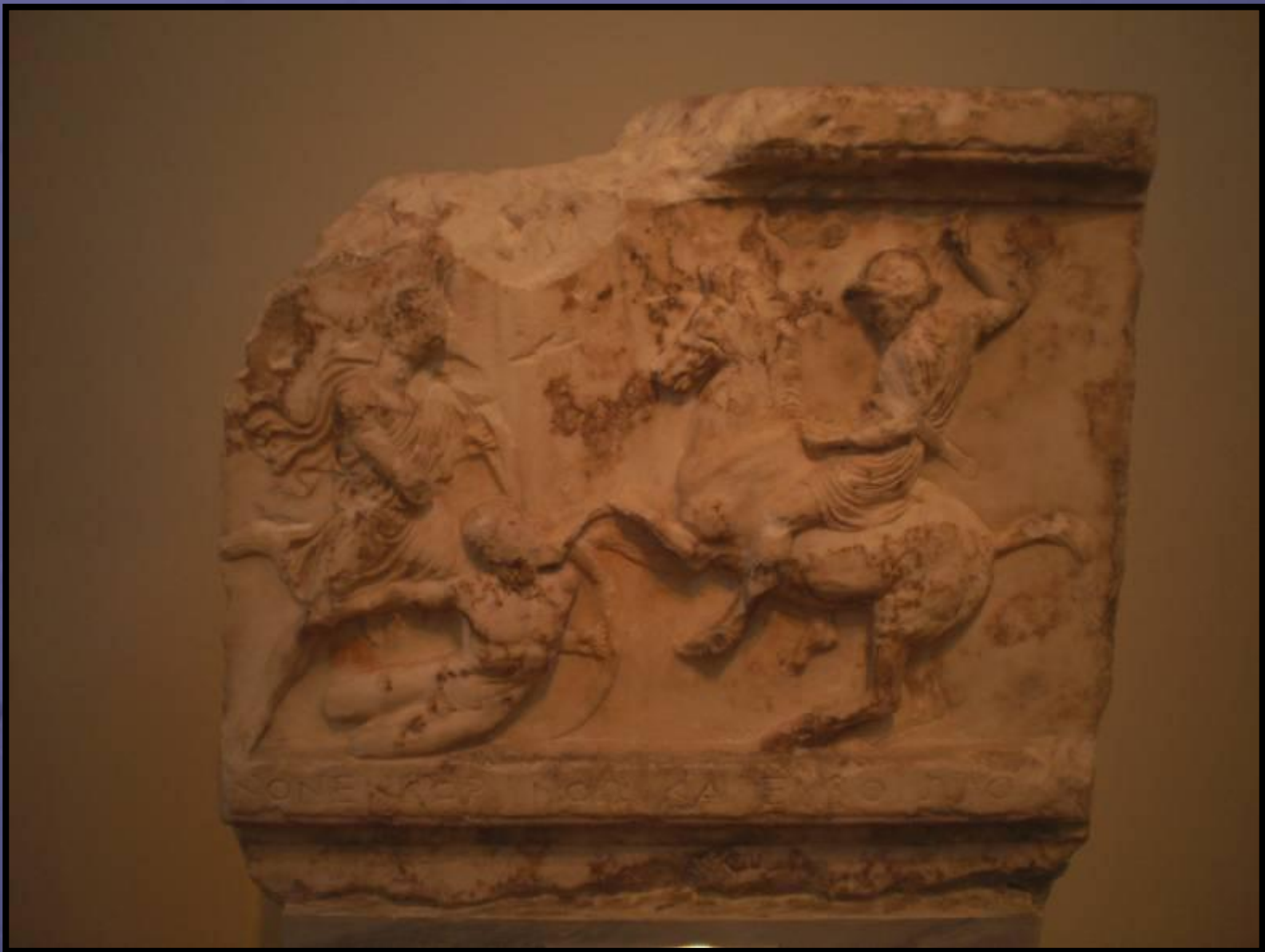
Ανάγλυφο από το πολύνανδριο των Αθηναίων ιπέων που σκοτώθηκαν στην Κόρινθο και την Κορώνεια της Βοιωτίας το 394 π.Χ. Από ένα δεύτερο δημόσιο μνημείο για τους ίδιους νεκρούς με εκείνο της προηγούμενης διαφάνειας. Αθήνα, Εθνικό Αρχαιολογικό Μουσείο 2744.