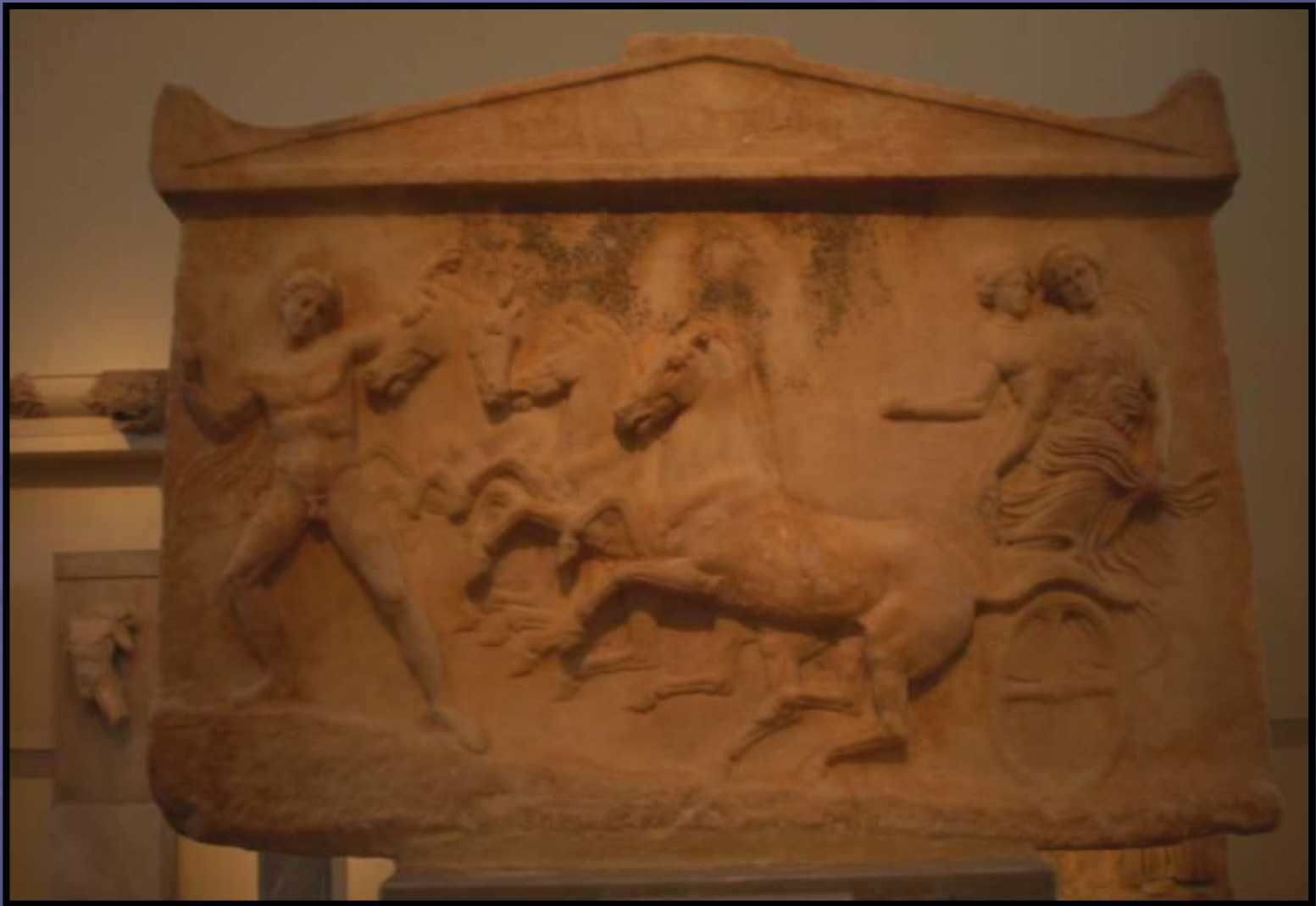
Αμφίγλυφο αναθηματικό ανάγλυφο, Αθήνα, Εθνικό Αρχαιολογικό Μουσείο 1783. περ. 410 π.Χ. Σε αυτήν την πλευρά απεικονίζεται ο Έχελος που αρπάζει τη Νύμφη Ιασίλη/Βασίλη, ενώ ο Ερμής οδηγεί το τέθριππο άρμα του.