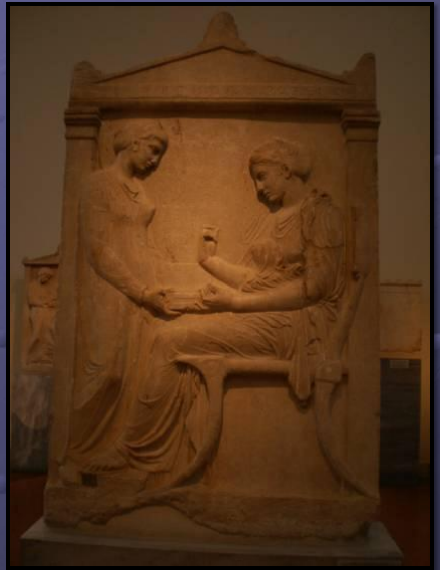
Το επιτύμβιο ανάγλυφο της Ηγησούς Προξένου. Περ. 400 π.Χ. Αθήνα, Εθνικό Αρχαιολογικό Μουσείο 3624.