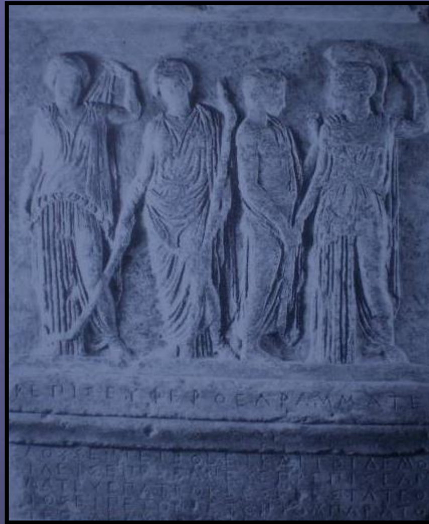
Ψηφισματικό ανάγλυφο σχετικό με την οικοδόμηση της γέφυρας των Ρειτών, 422/1 π.Χ. Δήμητρα, Κόρη, Αθηνά και Δήμος Ελευσίνος. Ελευσίνα, Αρχαιολογικό Μουσείο Ε 958.