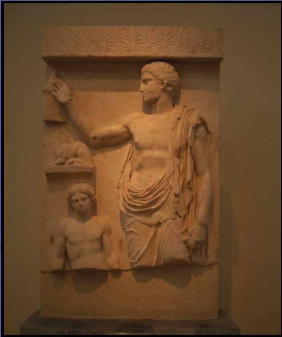
Στήλη νέου από τη Σαλαμίνα ή την Αίγινα, με έκδηλη την επίδραση της παρθενώνας ζωφόρου. Περ. 430 π.Χ. Αθήνα, Εθνικό Αρχαιολογικό Μουσείο 715. Από τα πρώτα επιτύμβια αττικά ανάγλυφα που επανεμφανίζονται μετά από τον απαγορευτικό νόμο της πρώιμης αθηναϊκής δημοκρατίας.