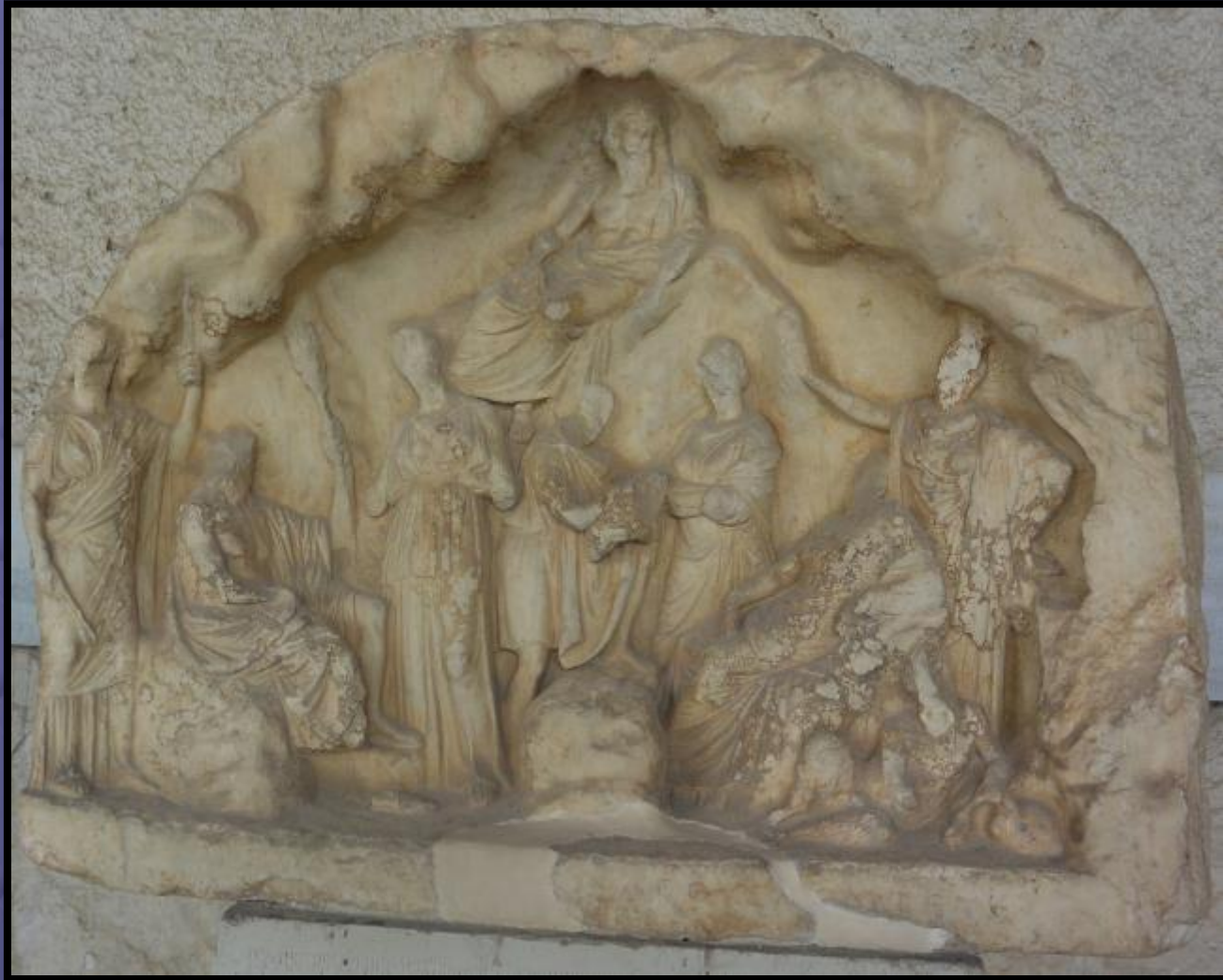
Αναθηματικό ανάγλυφο του Νεοπτολέμου στις Νύμφες και άλλες θεότητες. 340-330 π.Χ. Αθήνα, Μουσείο Αγοράς Ι 17154.