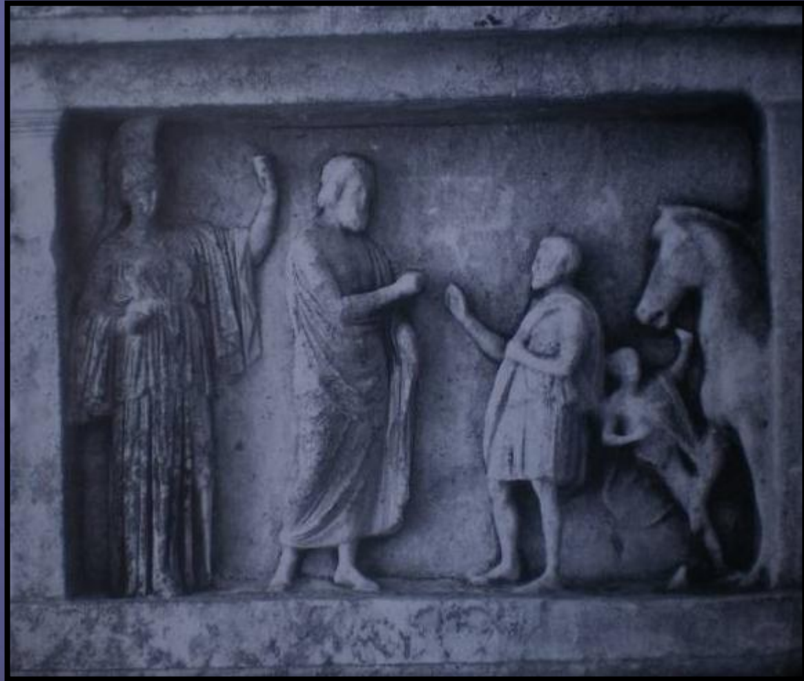
Ψηφισματικό ανάγλυφο που επιστέφει ψήφισμα για τον Σικυώνιο Εύφρονα. Αθηνά, Δήμος, Εύφρων. Η Αθηνά τιμά τον Σικύωνιο Εύφρονα και τους απογόνους του με το δικαίωμα του Αθηναίου πολίτη, λόγω της συμμαχίας που πρόσφεραν αυτοί στους Αθηναίους κατά τον Λαμιακό πόλεμο, 318/7 π.Χ. Αθήνα, Εθνικό Αρχαιολογικό Μουσείο 1482.