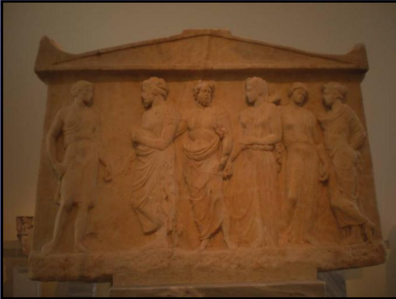
Αμφίγλυφο αναθηματικό ανάγλυφο, Αθήνα, Εθνικό Αρχαιολογικό Μουσείο 1783. Περ. 410 π.Χ. Στην πλευρά αυτή απεικονίζεται ο ποτάμιος θεός Κηφισός και οι σύμβωμές του θεότητας από το ιερό του στο Φάληρο.