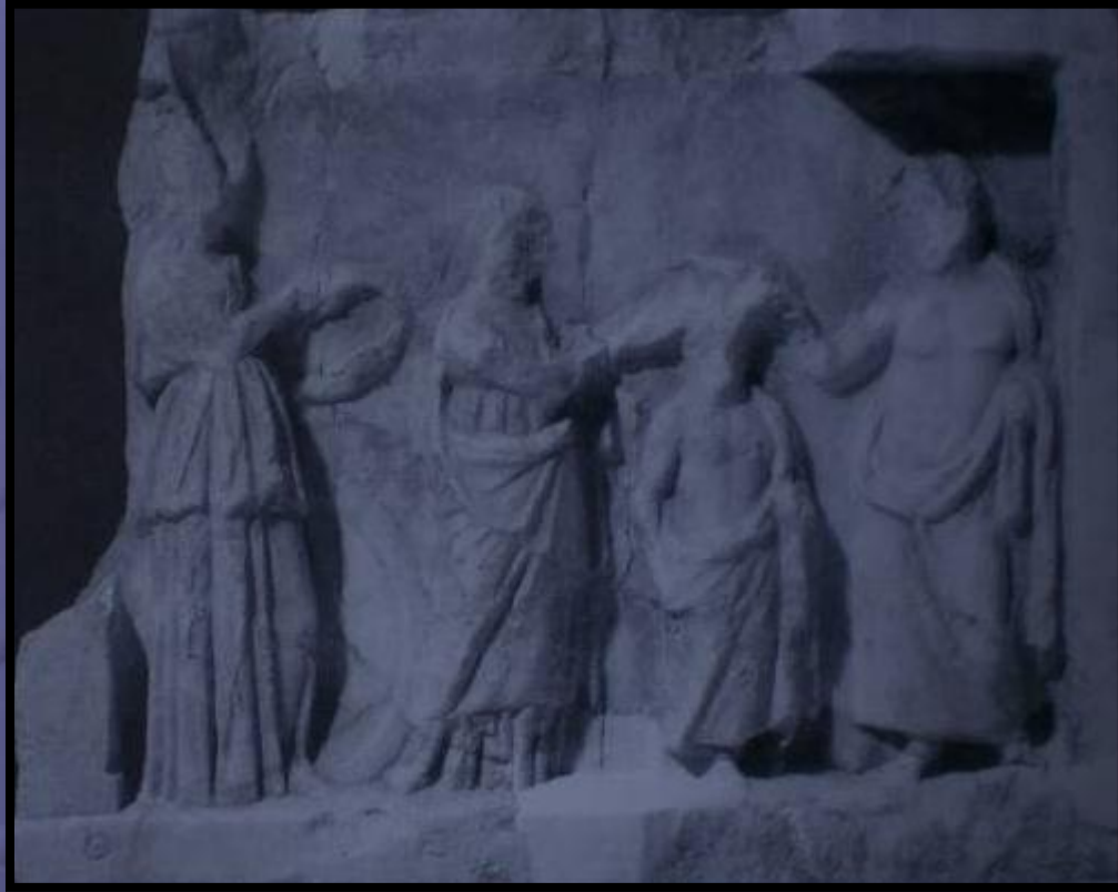
Ψηφισματικό ανάγλυφο που επιστέφει τιμητικό ψήφισμα του αθηναϊκού δήμου για τον Ασκληπιόδωρο. Αθηνά με στεφάνι, Βουλή και Δήμος στεφανώνουν τον τιμώμενο. 323 /2 π.Χ. Αθήνα, Επιγραφικό Μουσείο 2811.