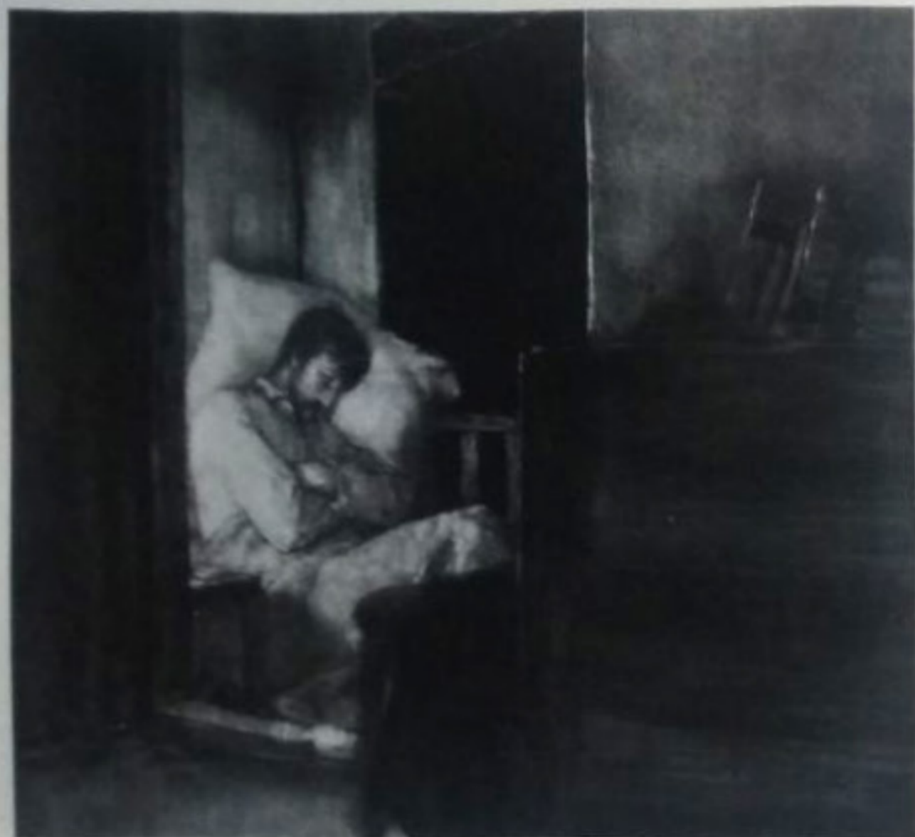
Νικόλαος Γίζος, 1881. Ο Φίλιππος Μίθριδης ύπνος και τα αναμνηστικά σπέρμα. Κάρβουνο και υδατοχρωματίδα σε χαρτί. Εθνική Πινακοθήκη, Μουσείο Αλέξανδρου Σούτζου, Κίεροδότερα, Αργεντινή Βακίλια.

των «μηχανισμών», βρίσκεται ο πυρήνας του μοντέρνου – και όχι στις μορφολογήσεις ορισμένων δημοφιλών κτιρίων ή έργων τέχνης.