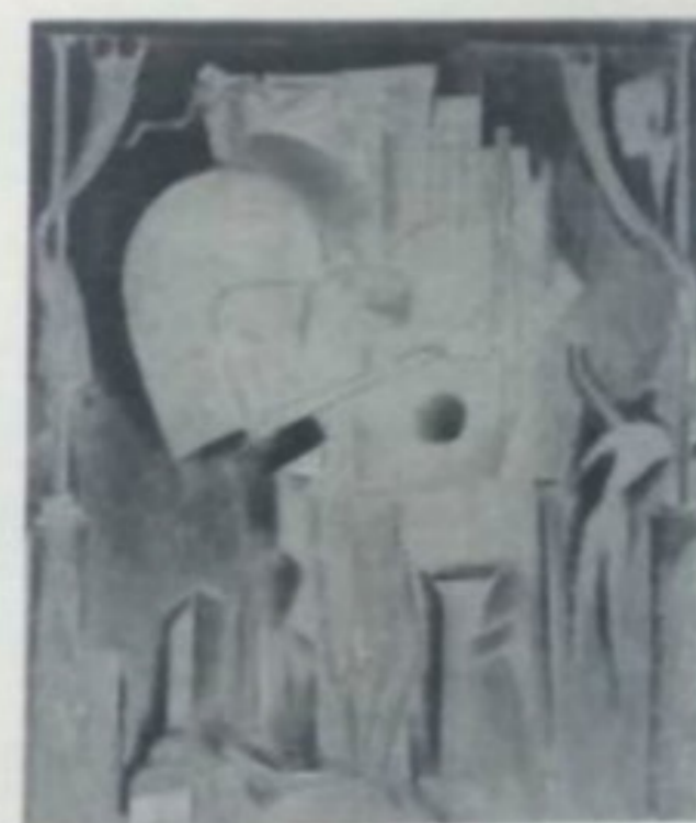
Κωνσταντίνος Παθβίνης. Η νύχτα αποκρίνεται στα παράπονά μου, περί 1933. Αύδη σε κιάβη. Εθνική Πινακοθήκη, Μουσείο Αλέξανδρου Σούτζου.

Αυτή, εξάλλου, είναι και η απαραίτητη προϋπόθεση για τη λειτουργία των «μηχανισμών».