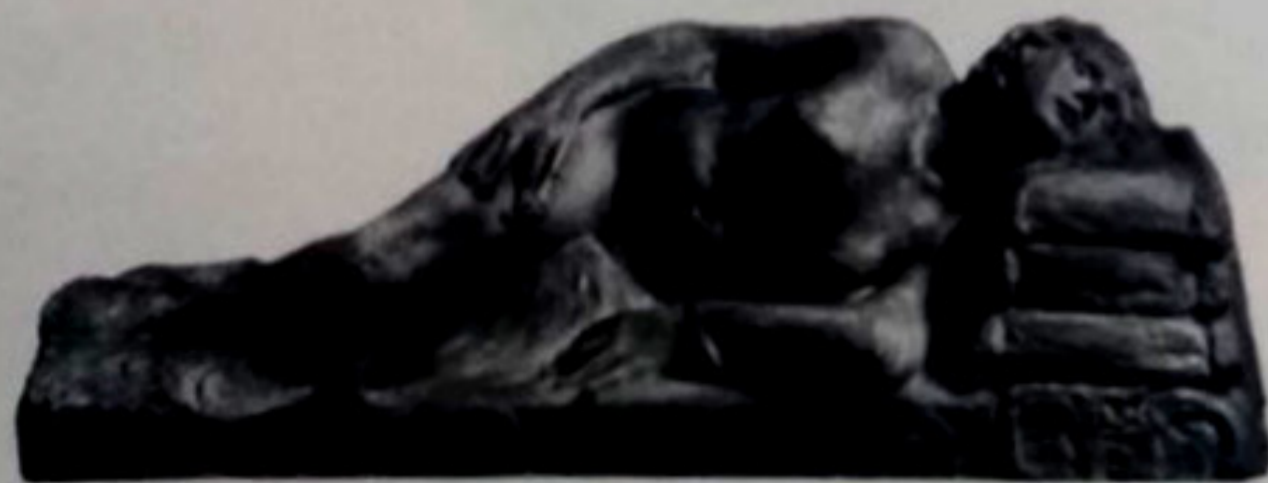
Γιαννούλης Χαϊκάλης, Αναπαύομαι , 1931, γίψος, Εθνική Πινακοθήκη, Μουσείο Αλέξανδρου Σούτζου.