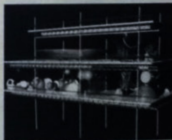
Τάκης Χ. Ζενέτος, «Ηλεκτρονική πολυδομία: Μικτά τριών μονάδων διαμετρή, κινούμενου κήπου και χώρου κοινωνικών εκδηλώσεων (στο άνω επίπεδο) σ' ένα τεταίο σημείο της κλιματικής κρητοποίησης», 1971, από Αρχιτεκτονικά Θέματα/Architecture in Greece.

ρίδα Το Βήμα (3/11/1971) περιγράφει σε μονόστηλο ρεπορτάζ την πρόταση ως εξής: «Θα ζούμε στα σύννεφα; Αυτό θα γίνει κάποτε στο μέλλον οπωσδήποτε. Και θα είναι αποτέλεσμα των τεχνολογικών εξελίξεων. Έτσι ισχυρίζεται και αποδεικνύει ο αρχιτέκτονας-πολεοδόμος και μελλοντολόγος κ. Τάκης Χ. Ζενέτος. [...] Χθεσινή ανακοίνωση-αναγγελία για το γεγονός τονίζει: Το ελληνικό «Σπίτι» του μέλλοντος καταργεί την κατοικία με την καθιερωμένη για εκατοντάδες χρόνια τώρα γνωστή έννοια. Θα είναι μια περιοχή στο κενό της ατμόσφαιρας χωρίς «υλικό» περίβλημα, οι κλιματικές συνθήκες της οποίας θα ελέγχονται. Η μονάδα αυτή θα είναι ενταγμένη στον ευρύτερο χώρο της «Πόλεως του μέλλοντος», μια πόλη χτισμένη με βάση τις αρχές της ηλεκτρονικής πολυδομίας: Ανηρητημένη, τρισδιάστατη κηπούπολη στο κενό της ατμόσφαιρας. Στο άυλο σπίτι οι άνθρωποι θα ζουν γυμνοί και, αν θέλουν, θα εκφράζουν την προσωπικότητά τους με μακιγιάζ χρωμάτων κ.ά.»