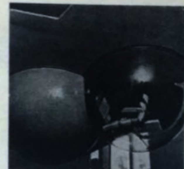
Τάκης Χ. Ζενέτος, «Ηλεκτρονική πολυδομία: Δίδυμα κενό-περίβλημα, μεταβλητής διαμόρφωσης, δύο συγκροτημάτων τρία-ενεργείων», 1971, από Αρχιτεκτονικά Θέματα/Architecture in Greece.

Όλη η ιστορία της νεωτερικότητας είναι η ιστορία της διέλευσης μεταξύ