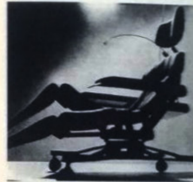
Τάκης Χ. Ζενέτος, «Ηλεκτρονική πολυδομία: Κινητός αποδοτικός φορέας του σώματος, πολυαξιακών χρήσεων, με πέντε τρία-ενεργείων», 1969, από Αρχιτεκτονικά Θέματα/Architecture in Greece.

της απόλαυσης αλλά, περισσότερο, για δύο διαφορετικές εκδοχές του ηδονισμού και της σωματικότητας. Στην πρώτη περίπτωση, των Breuer και Le Corbusier, η αντισηπτική αφαίρεση προσφέρει την ιδεώδη σκηνή για τα μοντέρνα lifestyles της κινητικότητας και της άθλησης, ενώ στη δεύτερη, του Loos, μια αναχρονιστική αρχιτεκτονική της απόλαυσης και της «μήτρας». Σήμερα πια, μπορούμε να υποστηρίξουμε χωρίς κανέναν ενδοιασμό ότι το υπνοδωμάτιο του Adolf και της Lina Loos είναι μοντέρνο, ακριβώς χάρη σε αυτόν τον αναχρονισμό του, χάρη σε αυτή τη διαπλή σχέση εγγύτητας και απόστασης με την εποχή του, που το καθιστά ένα είδος «αίλης εκτός τόπου». Αν κάτι εξακολουθεί να μοιάζει παράδοξο είναι ότι η στάση αυτή του «απολιτικού» Loos αποδεικνύεται σήμερα να έχει πιο ισχυρό πολιτικό χαρακτήρα από εκείνη άλλων αρχιτεκτόνων του αριστερού φονξιοναλισμού.