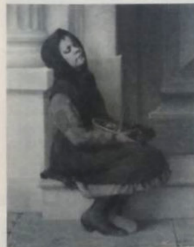
Γιόργος Ιακωβίδης. Η προσφυγοπούλα η Κοιμισμένη ανθοπώλις, μετά το 1900, σκίτσος. Ε. Κουτλιόδη. Εθνική Πινακοθήκη, Μουσείο Αλέξανδρου Σούτζου.

ρόλο διαδραματίζουν η διεκδίκηση μιας σειράς απωθημένων επιθυμιών (όπως ο ερωτισμός, η αναξωγονητική ανάπαυση, η μεσογειακή νωχέλεια και το άργος ) και η ιδεατή πληρότητα της ζωής . Όπως κι αν έχει, δεν νομίζω να έχει μελετηθεί επαρκώς η σωματική ποιητική που κατακλύζει το έργο αυτών των καλλιτεχνών, στην οποία εντάσσεται και η παράδοση του «ξαπλωμένου σώματος». Οι καλλιτέχνες και οι αρχιτέκτονες αυτοί, ανατρέχοντας σε ορισμένους αναχρονιστικούς μύθους της αρχαιότητας και της μετα-αναγεννησιακής Δύσης, αναζητούν μια νέα σχέση του ανθρώπου με τον κόσμο, η οποία επιχειρεί να διαπραγματευτεί πειστικά ερωτήματα πολιτιστικής ταυτότητας και επανατοποθετεί το παρελθόν σε ένα νέο χρόνο. Πάνω απ' όλα, όμως, διακρίνουμε τους τρόπους συγκρότησης του νεωτερικού υποκειμένου : η εσωτερική ζωή αποκτά πλέον δημιουργική υπόσταση, λόγο και συμβολική λειτουργία.