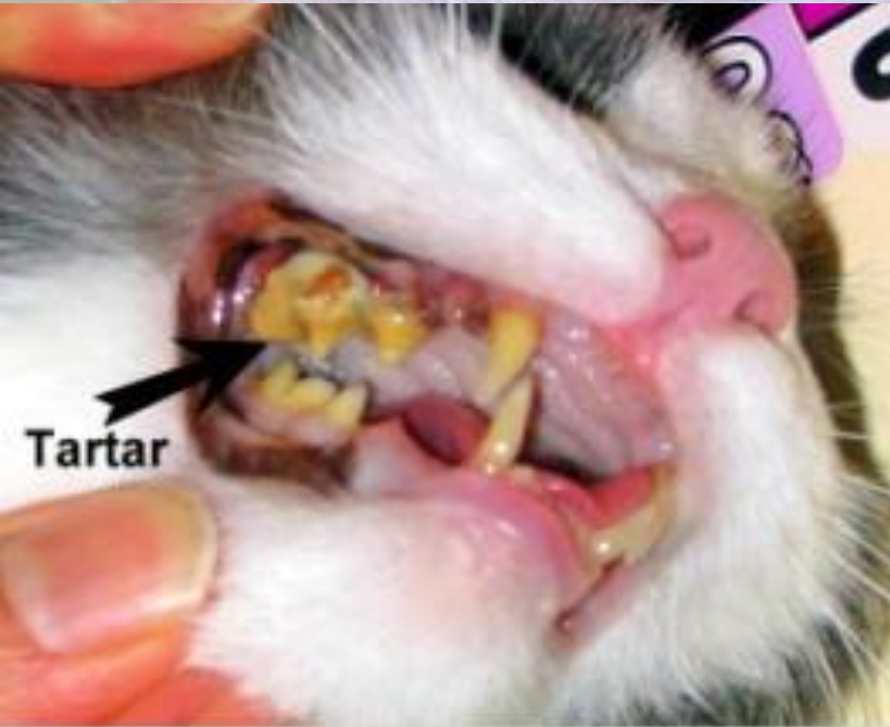
Right side before dental cleaning