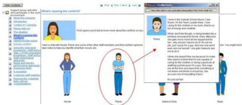
Εικόνα 4. Προβολή

υβριδικών αναπαραστάσεων οι οποίες απεικονίζουν στοιχεία με έναν ημι-ρεαλιστικό εικονογραφικό τρόπο (Dimopoulos et al, 2003).