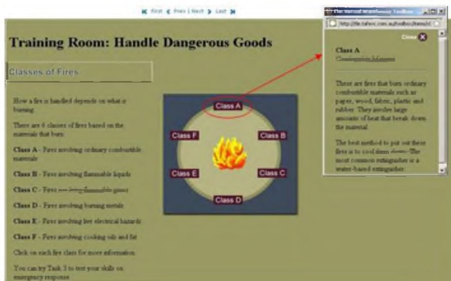
Εικόνα 1. Επεξεργασία

Στην συνέχεια ακολουθούν τρία παραδείγματα μαθησιακών αντικειμένων στα οποία εφαρμόζουμε το παραπάνω ερμηνευτικό πλαίσιο. Τα MA αντλήθηκαν από το αποθετήριο LORN το οποίο υποστηρίζεται από το Australian Flexible Learning Framework (AFLF, 2010).