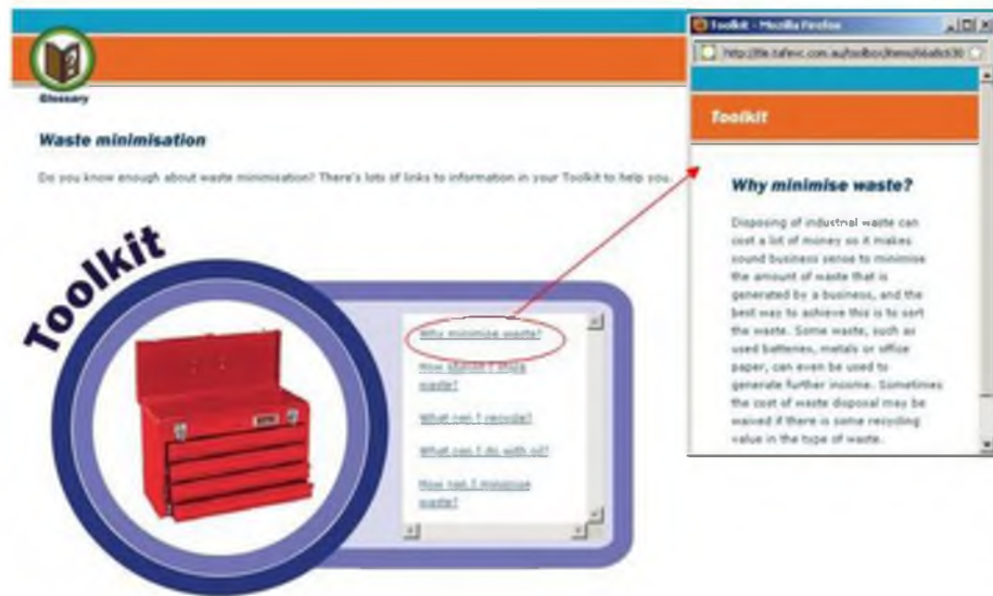
Εικόνα 2. Προαγωγή

Στις εικόνες 2 και 3 μπορούμε να δούμε την οργάνωση ενός τμήματος (ιστοσελίδα “Toolkit”) του εκπαιδευτικού περιεχομένου ενός ΜΑ (ΜΑ2, 2010) μέσα από τις σχέσεις προαγωγής και επέκτασης.