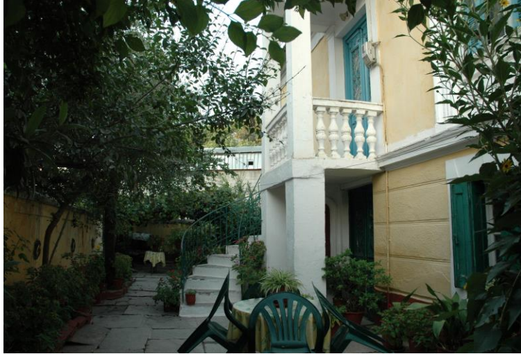
Εσωτερική αυλή σε παλιό αστικό σπίτι στα Ταμπάκικα, στη Λάρισα.