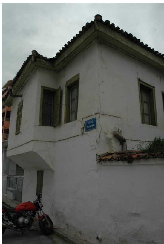
Σπίτι στην οδό Ζαρμάνη, στη Λάρισα.

Στην προβιομηχανική περίοδο, με εξαίρεση κάποιες μορφές, χαρακτηριστικής διαφορετικότητας, θεωρούμενης ως εκκεντρικότητας, η παραδοσιακή κοινωνία έχτιζε, σύμφωνα με το γενικά αποδεκτό πρότυπο, με μικρές, κατά περίπτωση, προσαρμογές. Σ' αυτό το πρότυπο, που ήταν καρπός συνεργασίας πολλών ανθρώπων, στη διάρκεια πολλών γενεών, όπως και της συνεργασίας, ανάμεσα στους κατασκευαστές και τους χρήστες των κτισμάτων, ενσωματώνονταν, εκτός των άλλων, κυρίως, η ιδανική έννοια του “κατοικείν” για τη συγκεκριμένη κουλτούρα, με τη συγκεκριμένη συλλογική κοσμοθεωρία.