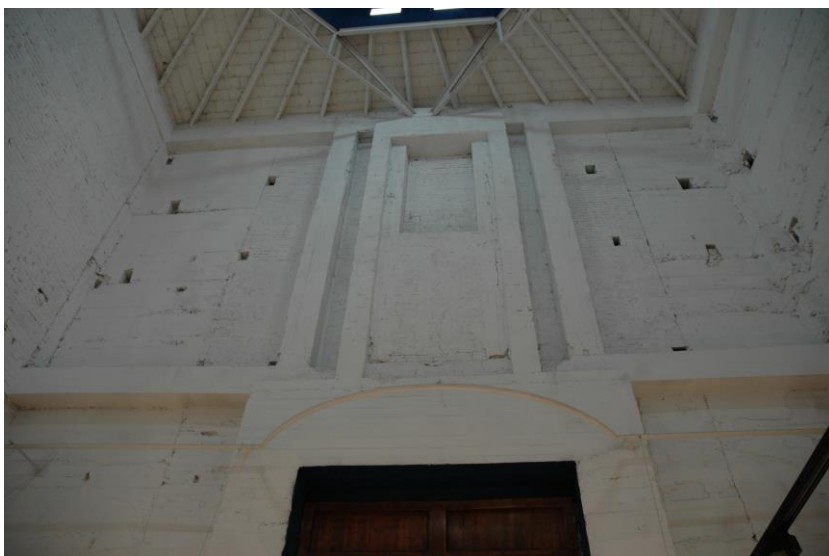
Ισπανικό Χωριό, Βαρκελώνη, «Καθεδρικός Ναός»: εξωτερική και εσωτερική άποψη.