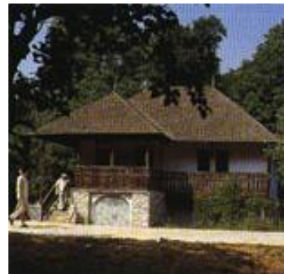
Μουσείο του Χωριού, Βουκουρέστι.