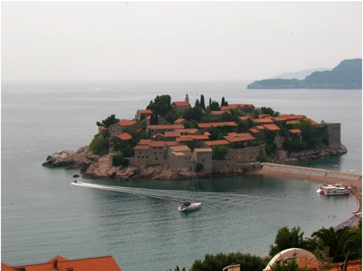
Νησί του Αγίου Στεφάνου, Μαυροβούνιο: πλήρης ξενοδοχειοποίηση του οικιστικού συνόλου.

Το 1981 ο φόβος των Ευρωσκεπτικιστών στην Ελλάδα ήταν πως, με την ένταξή μας στην ΕΟΚ, θα καταντούσαμε τα γκαρσόνια της Ευρώπης. Σήμερα, σχεδόν όλοι οι ορεινοί οικισμοί, ακόμη κι εκείνοι που δεν έχουν ούτε καν τις στοιχειώδεις προϋποθέσεις, επιζητούν συμπληρωματικό εισόδημα από τον τουρισμό. Με ποιο τίμημα όμως, όσον αφορά την αυθεντικότητα της εικόνας του οικισμού και την αληθινή ζωή των κατοίκων; Υπάρχουν ακραία παραδείγματα, από τη διεθνή εμπειρία, όπου ολόκληρα παραδοσιακά οικιστικά σύνολα μετατράπηκαν σε ξενοδοχειακά συγκροτήματα.