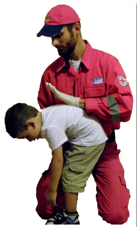
5 χτυπήματα στην πλάτη

Η ίδια τεχνική αντιμετώπισης απόφραξης αεραγωγού με αυτή του ενήλικα μπορεί να χρησιμοποιηθεί και σε παιδιά μεγαλύτερα των 1 ετών ή όταν το επιτρέπει η σωματική τους διάπλαση.