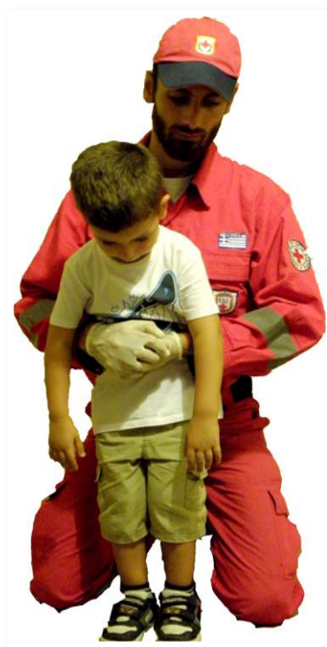
5 κοιλιακές ώσεις