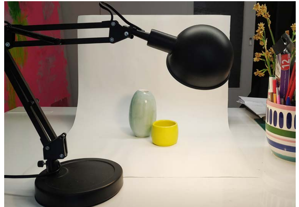
φως με προβολάκι