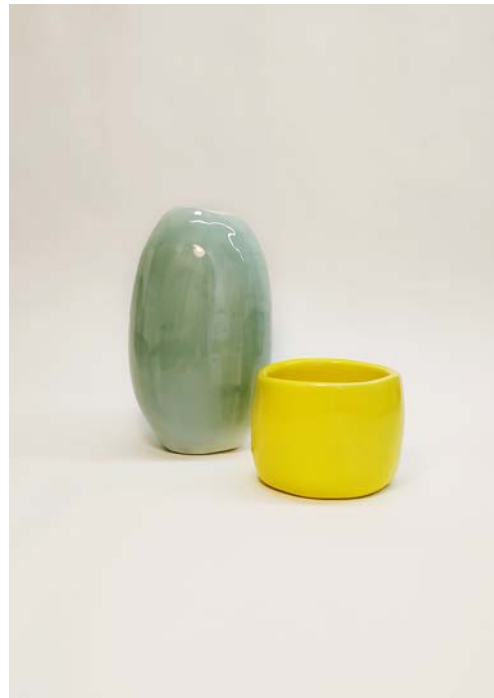
με επεξεργασία-κонтραστ & φωτεινότητα