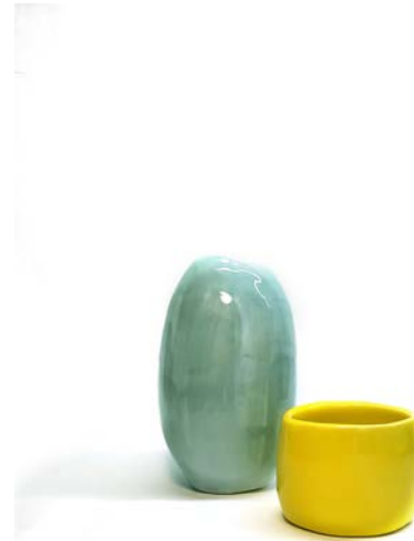
λευκαίνοντας το φόντο