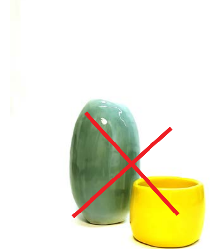
με υπερβολικά κοντράστ