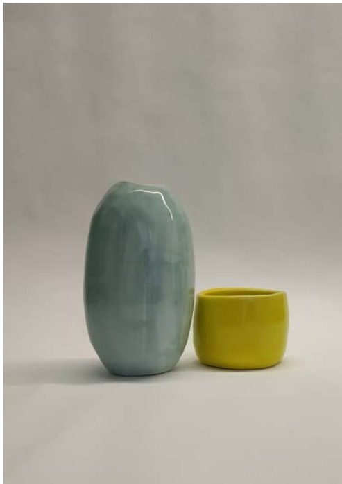
ανεπεξέργαστη-λήψη από το κινητό